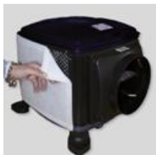
Filtro de aire G4